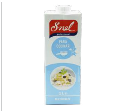
00139 Nata culinaria líquida SNEL Formato: Caja de 12 x 1 L Conservación: Refrigerado