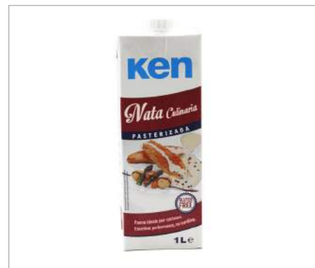
00189 Nata líquida Culinaria Formato: Caja de 12 x 1 L Conservación: Refrigerado