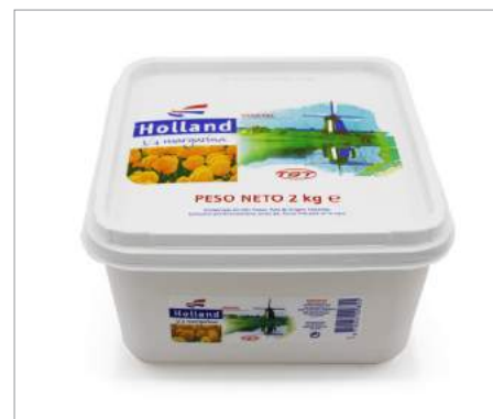
00220 Margarina 2 Kg Formato: Caja de 3 x 2 kg Conservación: Refrigerado