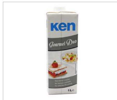
01883 Nata Ken Gourmet Dúo Formato: Caja de 12 x 1 L Conservación: Refrigerado