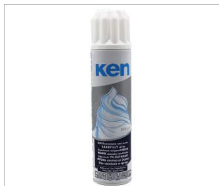
00190 Nata spray UHT Formato: Caja de 12 x 0,5 L Conservación: Refrigerado