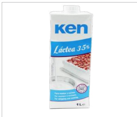
00726 Nata KEN láctea 35% Formato: Caja de 12 x 1 L Conservación: Refrigerado