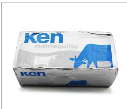
00708 Mantequilla Ken Formato: Caja de 10 x 1 kg Conservación: Refrigerado