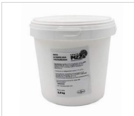
01594 Nata acidificada Formato: Caja de 4 x 2 kg Conservación: Refrigerado