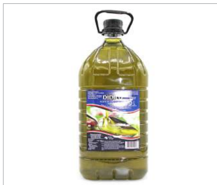
01181 Aceite de orujo de oliva Garrafa Formato: Caja de 3 x 5 l Conservación: Ambiente