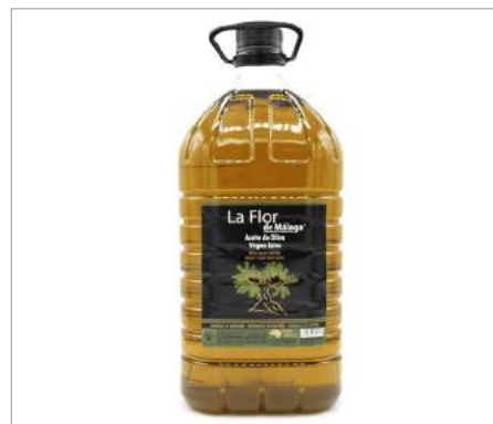
01180 Aceite de oliva Virgen Extra. Garrafa Formato: Caja de 3 x 5 l Conservación: Ambiente