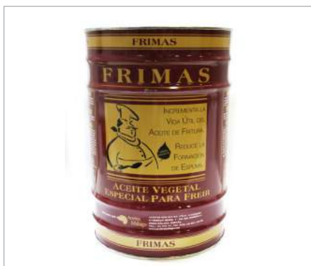
01183 Aceite freidora lata 25 l Formato: Lata 25 l Conservación: Ambiente