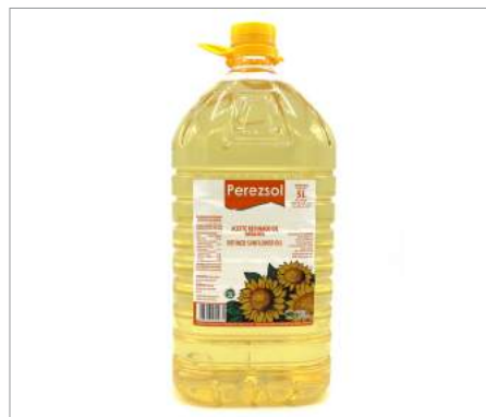
01182 Aceite de Girasol Refinado Garrafa Formato: Caja de 3 x 5 l Conservación: Ambiente