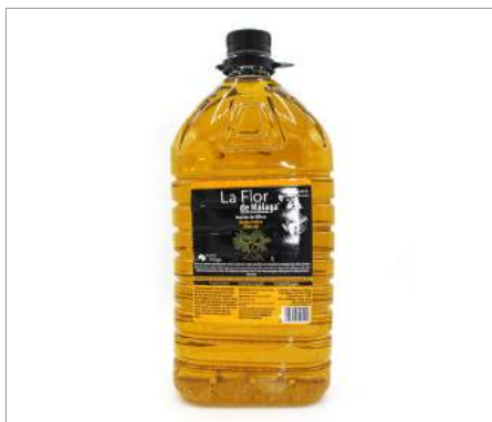
00976 Aceite de oliva suave Garrafa Formato: Caja de 3 x 5 l Conservación: Ambiente