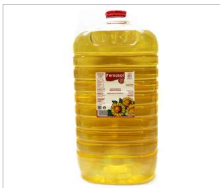
00138 Aceite especial Fritura 25 l alto oleico Formato: garrafa 25 l Conservación: Ambiente