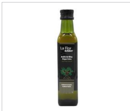
01184 Aceite de oliva Virgen Extra bot Cristal Formato: Caja 20 x 0,250 l Conservación: Ambiente