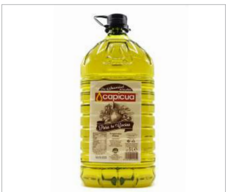
01912 Preparado graso Especial cocina Formato: 3 x 5 l Conservación: Ambiente