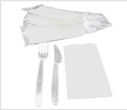
01652 Set tenedor - cuchillo servilleta transparente Formato: Caja de 400 ud.