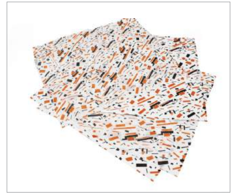
00395 Papel Antigrasa Formato: Caja de 1000 ud.