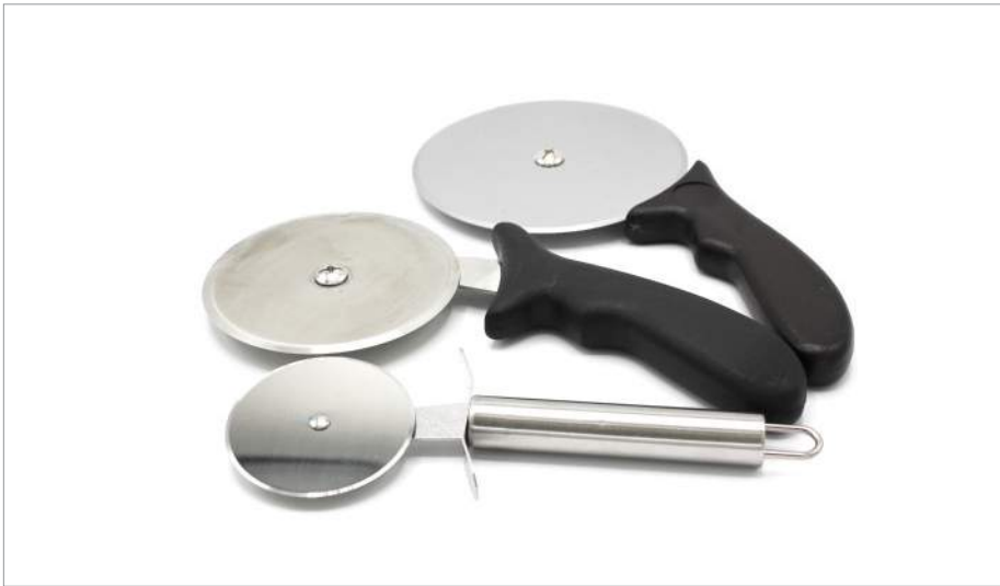
00836 Corta pizza (Cutter) 10,2 x 24 cm Formato: Unidad