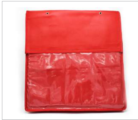
0029 Bolsas Isotermicas transporte pizzas Formato: Unidad