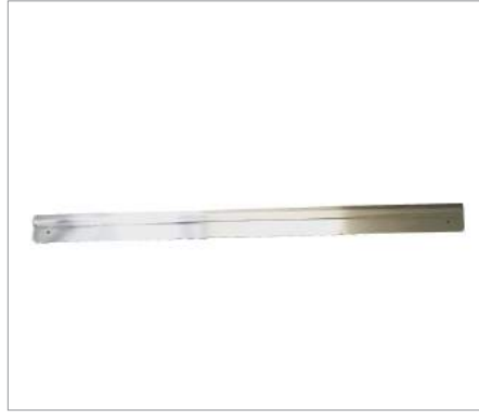
03129 Rack pedidos Formato: Unidad