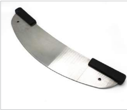
01158 Cuchillo pizza 2 manos Unidad Formato: