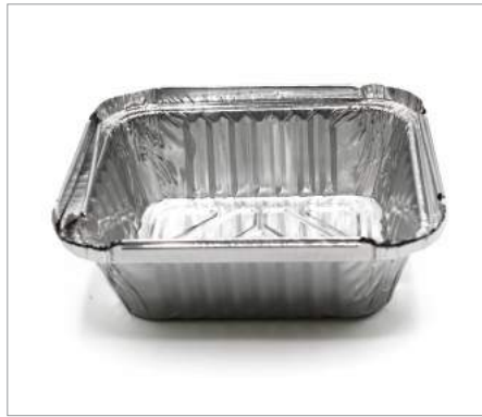
01774 Envase rectangular canto alzado