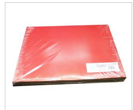
01639 Mantel Burdeos 30x40 cm Formato: Caja de 500 ud.