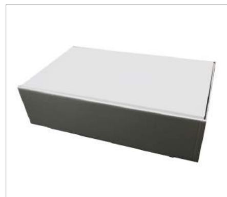
00490 Cajas para calzone 30x17x8cm Formato: Paquete de 100 ud.