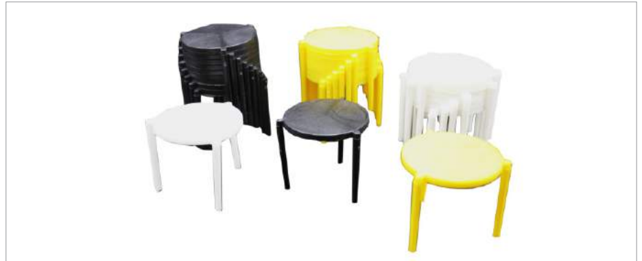
00404 Tripodes para pizza blanco/ negro Formato: Unidad