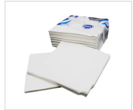
01612 Servilletas 33x33cm Formato: Caja de 3600 ud.