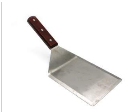
01204 Espátula 41,3 cm Formato: Unidad