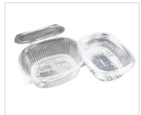
01653 Ensaladera 1500ml Formato: Caja de 200 ud.