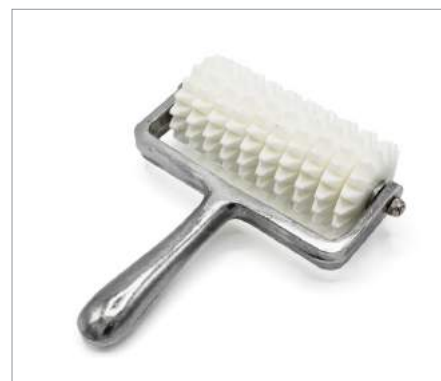
00845 Dough Docker Formato: Unidad