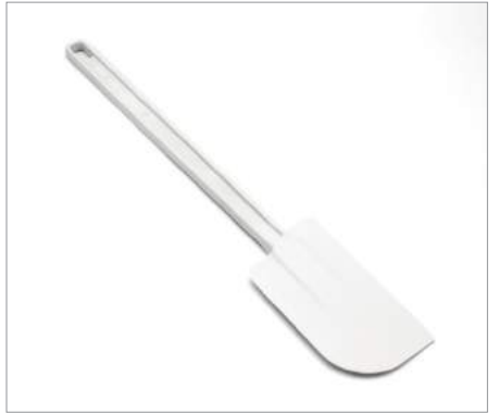
01201 Espátula pizza 30 cm Formato: Unidad