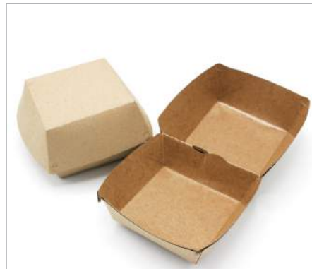
00393 Envase hamburguesa kraft Formato: Caja de 125 ud.