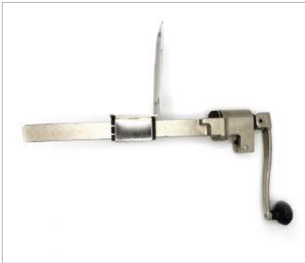
00891 Abridor lata Universal Formato: Unidad