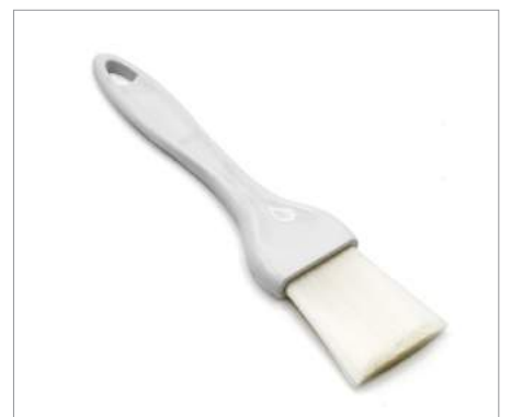
00839 Pincel uso alimentario Formato: Unidad