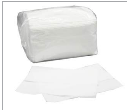
01582 Servilletas Maxiservice Formato: Caja de 6300 ud.