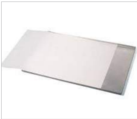
01611 Papel horno 40x60cm Formato: Paquete de 500 ud.