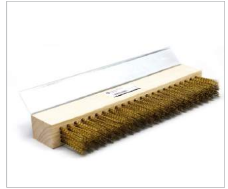
01781 R-SP Recambio Cabeza cepillo Formato: Unidad