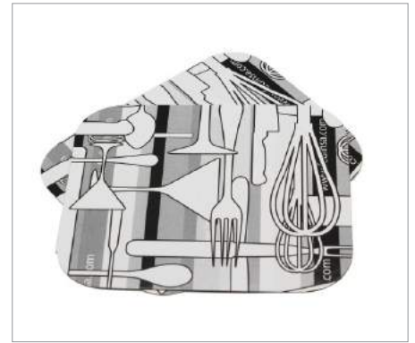
01775 Tapa envase rectangular canto alzado Formato: Caja de 1000 ud.