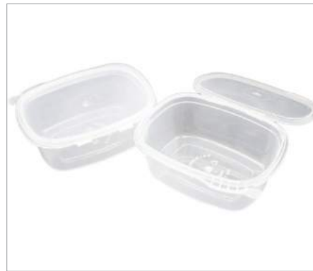
01699 Envase monoporcion inviolable Formato: Caja de 50 ud.