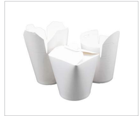
01645 Envase PASTA 780 ml Formato: Caja de 450 ud.