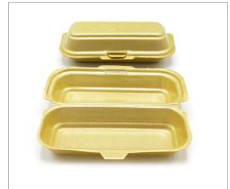
00394 Envase patatas gajo porex Formato: Caja de 125 ud.