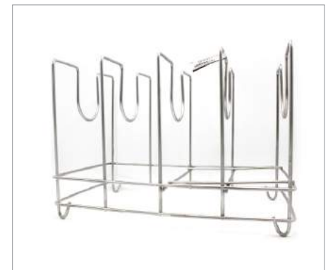
01207 Rack 37 x 22 x 25 cm Formato: Unidad