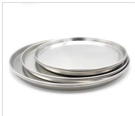
01198 Molde pan pizza Formato: Unidad