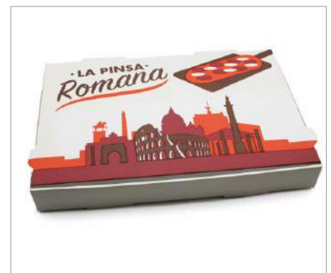
01844 Caja para Pinsa Romana 36 x 24cm Formato: Paquete de 100 ud.