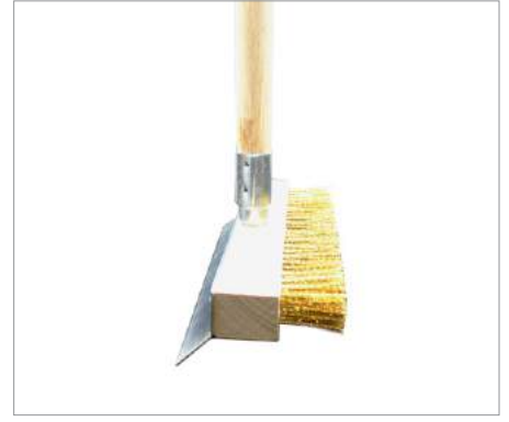
00627 Cepillo Limpieza hornos Formato: Unidad