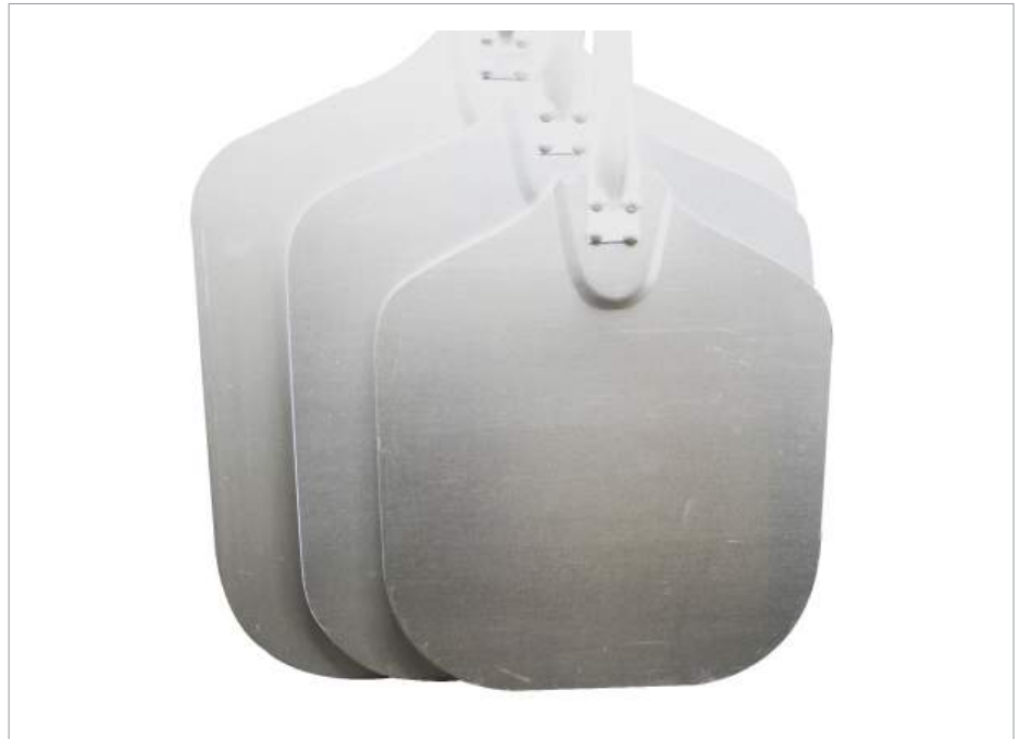
00965 Pala pizza 106 x 35,4 x 40 cm Formato: Unidad