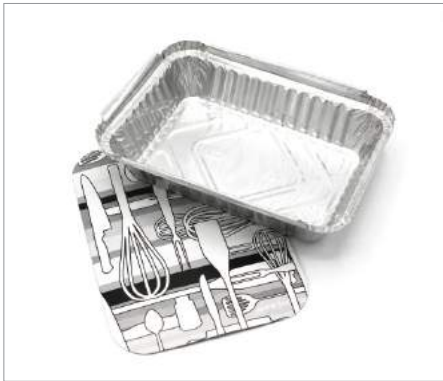
00871 Envase aluminio alitas 10 Ud + tapa Formato: Caja de 4 x 100 ud.