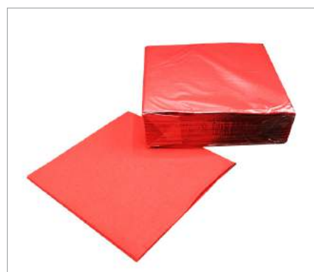
01635 Servilleta roja 40x40 cm Formato: Caja de 1800 ud.