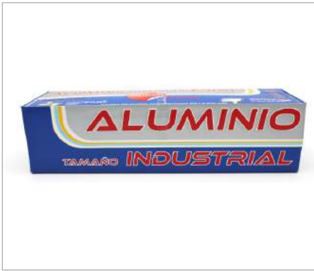
00658 Bobina aluminio Formato: Caja de 6 ud.