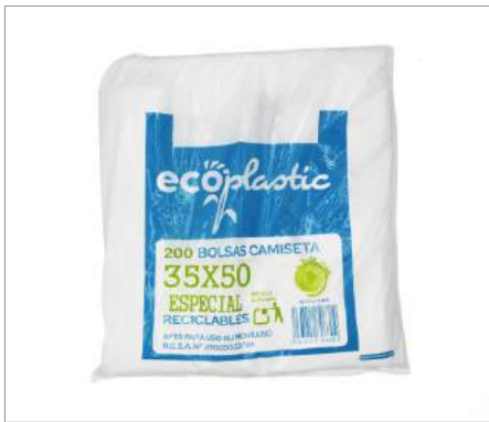
00397 Bolsas camiseta 35 x 50 (200 Ud) Formato: Caja de 1000 ud.