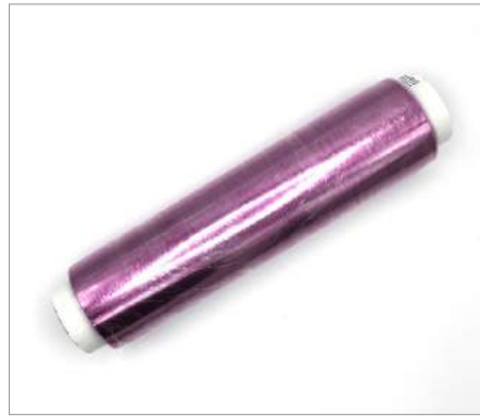
A007 Bobina P.V.C 30 x 300 Formato: Caja de 6 ud.