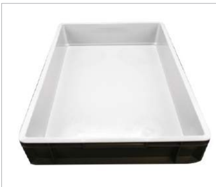
00683 Gaveta plástico masas 60 x 40 x 13 cm Formato: Unidad