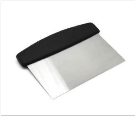
00837 Rascador de masas Formato: Unidad