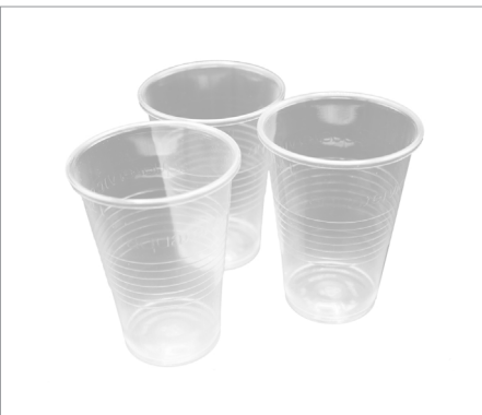
01581 Vaso plástico 300 c.c. Formato: Caja de 2500 ud.