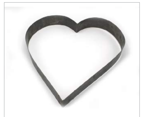
01662 Molde Corazón Formato: Unidad