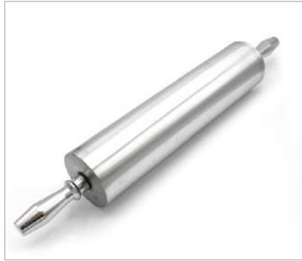
00847 Rodillo Estirado Aluminio (45,7 cm) Formato: Unidad