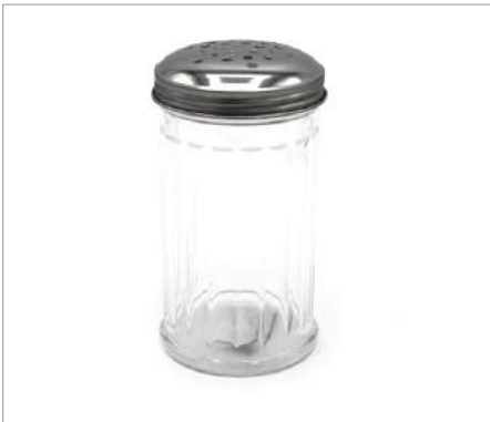
01760 Espolvoreador de queso Formato: Unidad