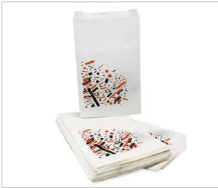
00396 Bolsas Minis