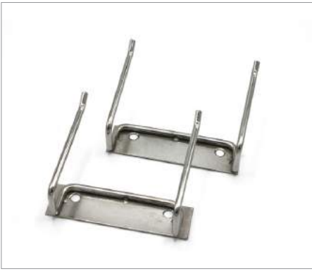
01205 Rack para pala Formato: Unidad