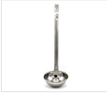
00850 Cucharón salsa Formato: Unidad