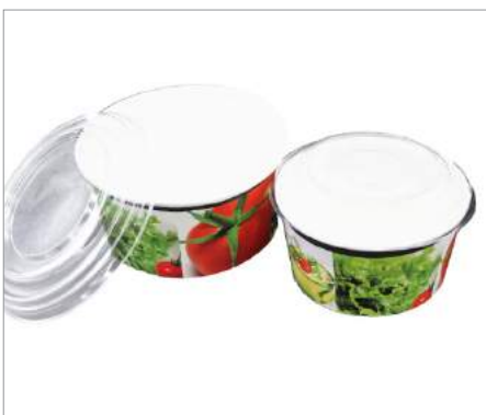
01648 Ensaladera papel 600ml Formato: Caja de 360 ud.