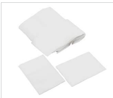
01213 Servilleta miniservice (12000 ud.) 17x17cm Formato: Caja de 12000 ud.