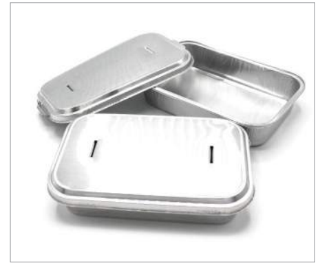
00406 Tapas envase aluminio alitas (6 Ud) Formato: Caja de 1000 ud.